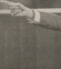
მასშილიანი ადვანის უკან დასახევი გუნდის ადვანი

ინტერბანკი და ნაპოლის დამირსპირები შესახებ ძალიან მეტრი იქნება ამ მატჩში, ამ თუხას აღიკვანდებურები. მით უმეტეს, სათქმელი ინტერბანკის მეთაი, რადგან ერთმანეთს