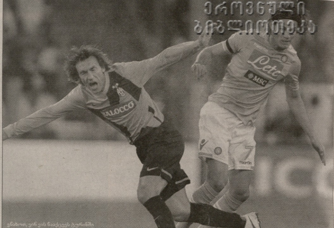
მეზობელი გუნდის წამყვანი ტურინი

პირსპირი ჩემპიონატის ლიდერები წარდგებიან. ორივე გუნდს თამაზარი რაოდენობის ქულა აქვს და როგორც ასეთი ლიდერს ამბობენ, ასევე უნდა ექნეს დღევანდელი შეხვედრის, მიმდებარეულ ფაზის ორივე მატჩში გამაჯობებული.