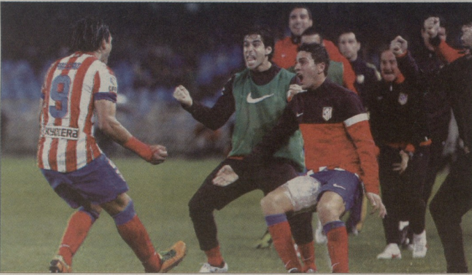
ეს ეს არის რეალმა ფაბრიკაო ატლანტიკო ლიგაში დატოვა

უკვე შეგუებული ვიყავით, რომ ლა ლიგა კვლავ იქნება (ველას-ტოვის კარგად დაცვით) დაპირისპირების არაღივნივანი, მაგრამ არგენტინელი სექციონისტის, დიეგო სიმონის „ატლანტიკო“ შესანიშნავი სურათში შემოგვავაჭრა. 8 ტურის შემდეგ უკვე თამაშმა შეიქმნა თქმა, რომ მადრიდელმა წარმატება იტყვის სიღრმეზე არ არის შემთხვევითი. „ლის რიხილინოს“ უკავს შედეგი ზოგჯერ არგენტინელს მიაღწიოს ყოჩაღი ახალგაზრდა მწვრთნელი, მკაცრ მსოფლიოში აღმათ საუკეთესო ცენტრფორვარდი (რომელსაც ახლახან „მარკა“ ოქროს საბალო უწოდა) და არ დაგვავიწყდეს, რომ გუნდს უდიდეს ტრადიციები მოსდევს. „პარსელონას“ და „ატლანტიკოს“ 22-22 ქულა აქვთ - ყველაფერი სერიოზულადაა.