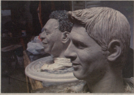
მისი და პულა, პულა და მისი - 4 გოლიც და ლეო ფეხბურთის მეთვის რეკორდსაც დაამბობს.

იტალიანი ტური ისე არ ჩაიგოს, რომ არასასამართლო ფაქტებს ადგილი არ ჰქონდეს, თუმცა „კალონი“ ამტკიცავდა ძალიან სინტერესო. სერია B-ში, „ალკოისთან“ და „ვერინას“ მატჩის (0:2) სტრუქტურა ტროლივში ძალიან ცუდად მოიქცნენ: არბოლი ვილას ინტერაქტივი ვარდებულები ლიგონიერი ფეხბურთელი მორიხი შერევატყვეს. „ეს გუნდი არ იმხეობენ არსებობა“-ს ვინაიდან მატჩის შემდეგ დიდი ნივთის კაპიტანი ლეო. აქვე ძველი ისტორია: ვერინას“ დანებდა 1996 წლის ყველაფერი გააკეთეს იმისათვის, რომ მათ გუნდში შეავიანონ ფეხბურთელი არ გადსხვინო - ტროლივს და დიდი შავი თეგონი გამოიკიდეს, რომელსაც ვერინა „ოგო, გო away!“