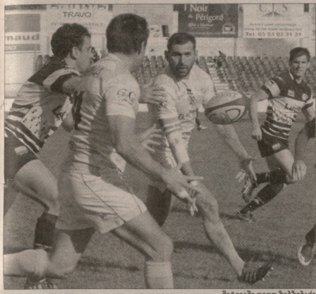
მეექვსე თველი ზიზიზიზი

საპროფესიონალს ჩემპიონატ დელო 1 დივიზიონი მეექვსე ტურის შედეგები გამოაჩინა. ქართველ მოკვლეებს უკვე მეორე სატურნირო ცხრილის სათავეში აღარავინა, თუმცა პლეი ოფში გახლავთ მანსს „შვიდი ქართული“ გუნდი ინარჩუნებს.