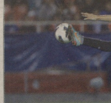
მესის ნახსი ნულუსა შეუდარებლად თამაშობს

8 ტურის შემდეგ 15-15 ქულით მესი და „სელიტას“ უმთრინო ლიდერი ხე-