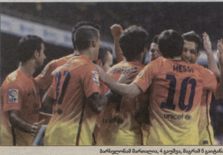
პარსელონა მარტილა, 4 გაუტეა, მაგრამ 5 გაიტანა