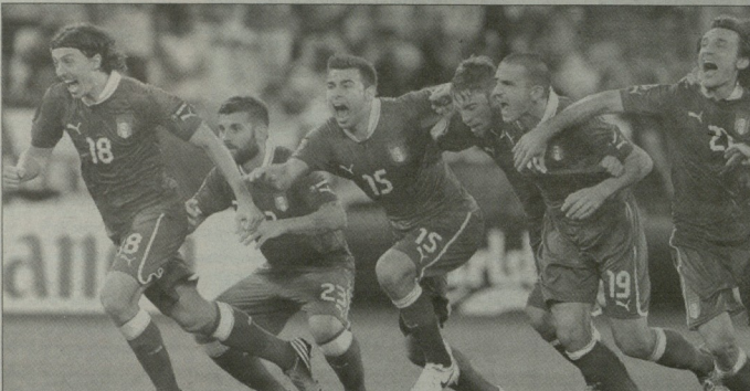
იტალიის ნაკრები ევროპის ჩემპიონატზე