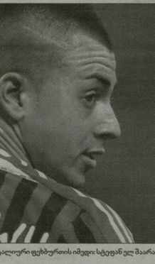
იტალიური ფეხბურთის იმედი სტეფან ელ მარკარი

ზუსთო კი ვთქვით, რომ ცუდზე აღარ ვისაზრებოები, მაგრამ წლის იმედაც რუგებზე უნდა ვთქვათ ჩაჯორენზე აუცილებლად უნდა ვთქვათ იროვედ სტავეა ამ შემთხვევაში, არა ფეხბურთელი, არამედ მთლიანად გუნდი ვეგავს მხედველობის, ის, რაც 2012 წლის ზაფხულს