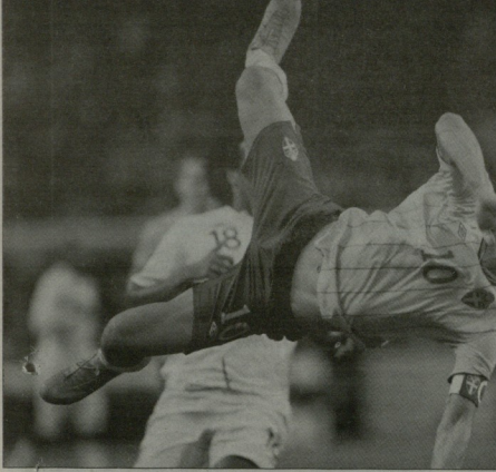
წლის გოლის ავტორი ზულბანი იბრაჰიმოვიჩი

ზულბანი იბრაჰიმოვიჩი წლის გოლი 14 ნოემბერს, მედვიტისა და ინგლისის ნაკრები შეხვედრის ამანაგავურ მატჩში გაიტანა. შეუძლია „პარაკეტულ“ შეადგინა - 25 მატჩიდან, მანამ ეს იმ გოლის ძალიან მოკრძალებული ადენაა. ფრანგ ზულბანის გოლი წლის საუკეთესო გოლის გამოკითხვაში ვეღარ შეუტანა, რადგან გამოკითხვა დაწყებული იყო, მანამ ამას რა მნიშვნელობა აქვს - ეს არის გოლი, რომელიც ძალიან დიდხანს გვესმისება. მედიის ნაკრების მებრძოლი იმ მშენებელი საღამოს ინგლისი იყო, რაც იმას ნიშნავდა, რომ ეს არ იქნებოდა ერთი რიგითი ტესტ-მატჩი. 90-ე წუთი მიმდინარეობდა, ზულბანს სამი გოლი ჰქონდა