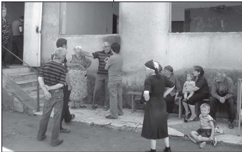
სულზე 13 ლარი იყო და სად 13 ლარი და სად 6 ლარი. თუმცა ამ მთავრობისგან ვეცე რაღაცა. ჩვენც ცოდვები ვართ და ვინმემ მოგვხედოს.“

„არავინ არ მოუშავს, მოხარულად ერთი ნაბიჯი მოუშავს მართლ, ორი პატარა ბავშვი მყავს და სიცივით ხომ არ მოგვეცეს, ქორი გავარდა, რომ 6 ლარს გიმატებენო თითო