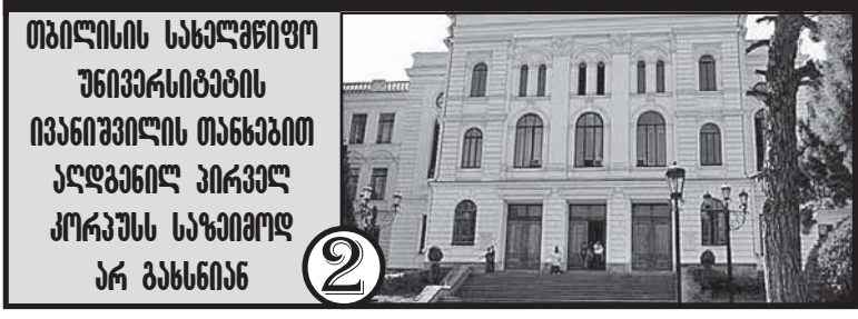
თბილისის სახელმწიფო უნივერსიტეტის ივანიშვილის თანხებით აღდგენილ პირველ კორპუსს საზიჟოდ არ განხნიან

7 მთავარ გამხსნელს მაკრატელი დაუბლაგვდა?