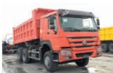
Самосвалы HOWO 25 тонн