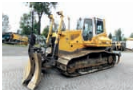
Бульдозеры Liebherr PR 724 L