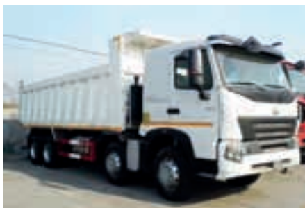
Самосвалы HOWO 31 тонн