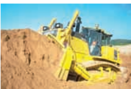
Бульдозеры Komatsu D155AX