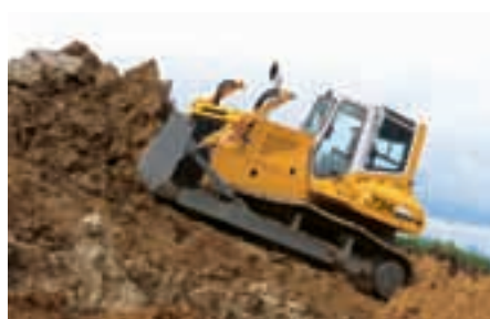
Бульдозеры Liebherr PR 734 L