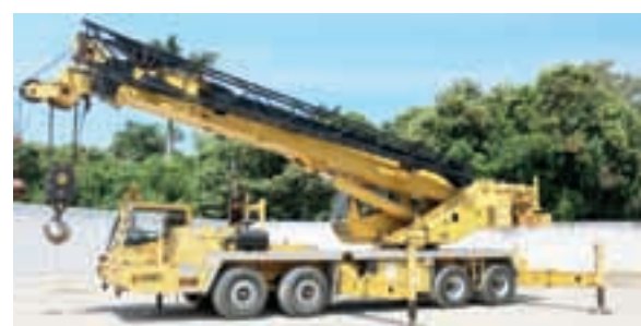
Автокран Grove - 32 т