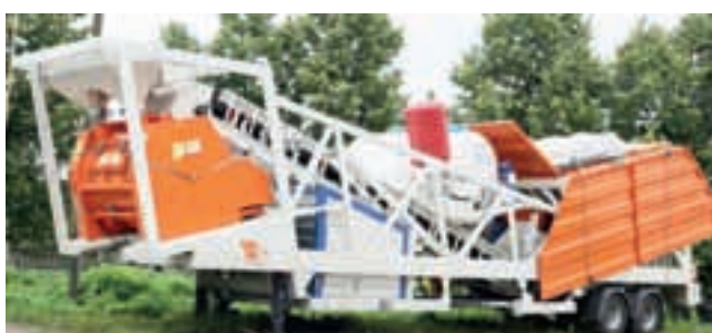
БСН Semix - 80 м³/час