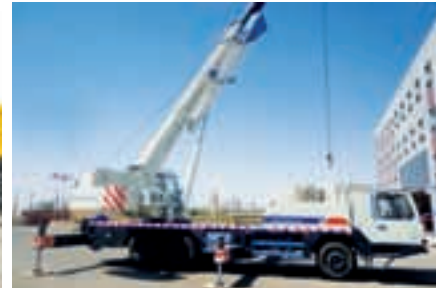
Автокран Zoomlion - 25 т