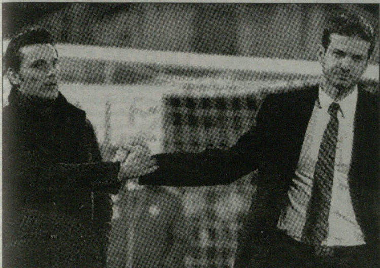
მწვინელებს ყველაფერი სახეზე ანერით