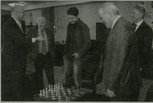
ე და ფოთის მე-2 საჯარო სკოლის მოსწავლეებიც ჩაერთვნენ. „შამათი ერთ სვლაში“ - ასეთი იყო გაკვეთილის თემა.

საპარტოვლოში საქმიანი ვიზიტით იმყოფებოდა პლანეტის ერთ-ერთი უძლიერესი დიდოსტატი, მსოფლიოს მე-13 ჩემპიონი გარი კასპაროვი.