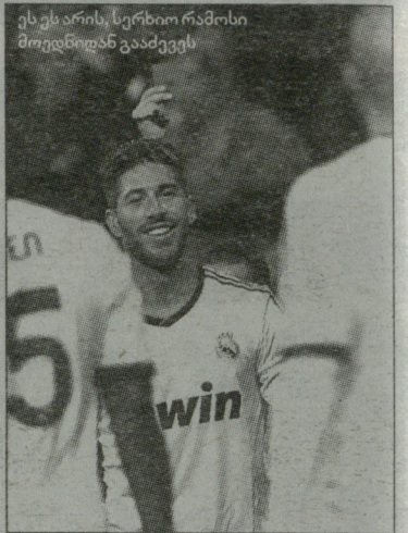
ეს ეს არის, სერხიო რამოსი მოედნიდან გააძევეს

"მანჩესტერ იუნაიტედთან" 1:1 დასრულებულ მატჩში რამოსის კისერზე დენი უელბეის გოლი, ესპანელმა მცველმა ვერ მოასწრო ფორვარდთან საპერო დუელში შესვლა და ახალგაზ-