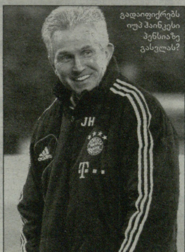
გადამოწმებს იუპ ჰაინკესს პენსიაზე გასვლას?