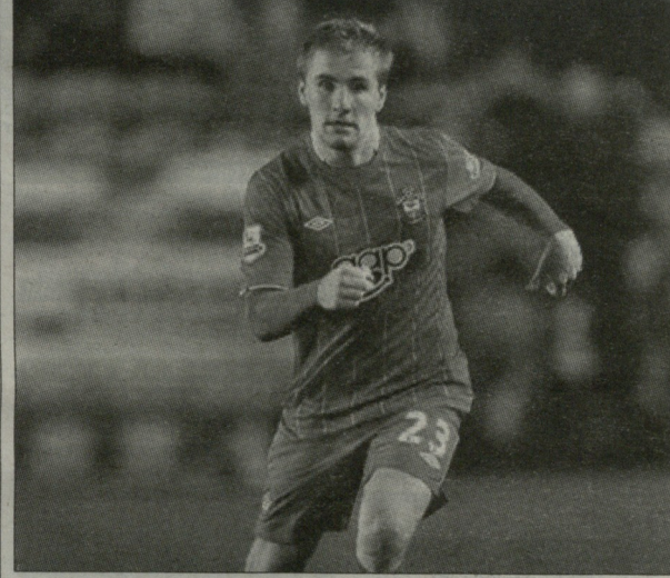
ჩელსიში ლუკ მოუს ველი კოულის მემკვიდრედ განიხილავენ

„ჩელსი“ „საუთემპტონიდან“ ინგლისის ახალგაზრდული ნაკრების 17 წლის ნევრის ლუკ მოუს შეტევა სურს. ლონდონელები მზად არიან, ნიჭიერ თინეიჯერში „წმინდანებს“ 10 მილიონი ფუნტი გადაუხადონ. „ჩელსის“ მარცხენა მცველის პოზიციაზე ორი ფეხბურთელი ჰყავს 32 წლის ემლი კოული (კონტრაქტი 2014 წლის ზაფხულამდე) და 23 წლის რაიან ბერტრანი (ხელშეკრულება 2017 წლის ზაფხულამდე). ინგლისის ნაკრების ვეტერან ვარსკვლავი „სტემფორდ ბრიჯზე“ ლირსტონი მემკვიდრე სჭირდება. დიდი იმედების მოუხედავად კი ბერტრანის თამაში სერიოზული პრობლემა არ შეიქმნება. რიგი გამოცემები არ გამორიცხავენ, რომ ფულის გარდა „ჩელსი“ „საუთემპტონის“ რაიანის სატრანსფერო უფლებებიც შესთავაზოს.