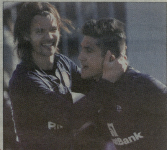
კლესთი-დინამო 0:1. ჩისკოს (მარჯვნივ) ასისტენტობა კოტომ გაუწია

ჩისკოს ერთი, ლეჰთაძის ორი, ჟუნორის სამი, დეკანოიძის ოთხი... დილას ექვსი, ჩიხურას რვა! ტორპედომ გაბრას ვერ მოუგო, ვიტ ჯორჯიამ - სპარტაკს! ვიტალურბი ბათუმთან დამარცხდა... 2-4