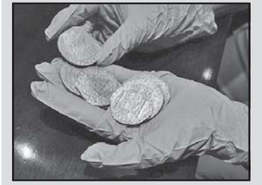
მსახურით 200 წლის უძველესი...