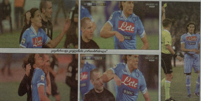
კავანისა და კიკლინის „ორთარბოლა“