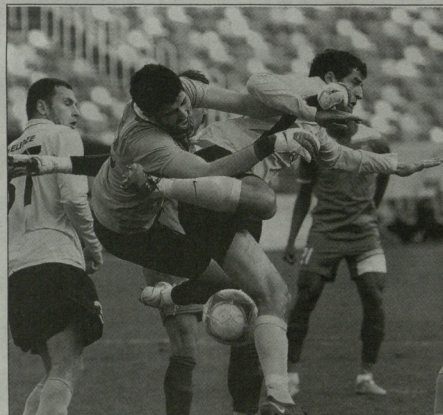
თამაშის ყველაზე მაგისტრალური ფოტო