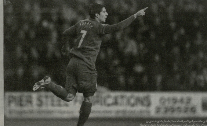
ლუის სუარესის სეზონში მერქარ პლეიერის ნებისმიერ სიტუაციაში დაყვანიდან დასწრეა