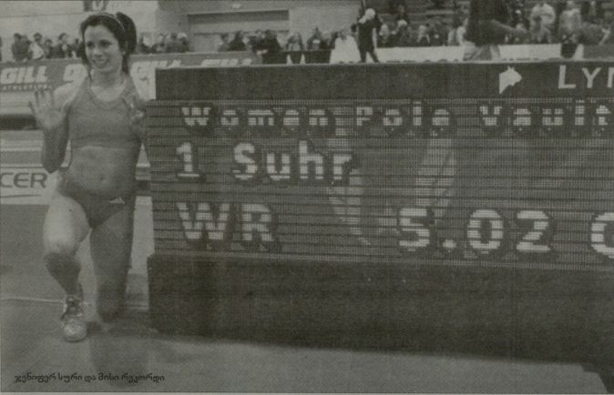
ვენიერ სურმა და მისი რეკორდი