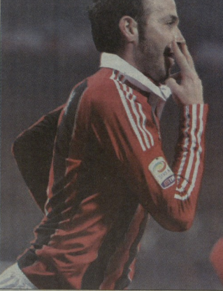
ჯავალიო მაციონი „ლაციოს“ ორი ვაჭარა