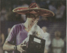
ნადალი ტიტულენტს აგრეოვებს

პაპაუკუს ტურირის იეივე სტატუსი ჰქონდა, როცა იგი მოხდა წიშობლობა. მაგრამ იქ სავალი გრუბისი იყო და სტატუსი რაღაც ორიილიად, ვისაზარდა და არაეტიმური წოგურთოეულია და კომლიტდა. იქ რაედა რაფაელ ნადალიც. უეკასტნებში, რომ მხოლოდის მეტეუე წოგანებისთვის ეს იყო მესამე ტურირი ნელს დინა-დელ-მარინ რაეამ სენსაციურად ნაავო ორასიო სებალიოსთან, სან პაპულის გადამწყვეტი მატჩი კი დამაჯერებლად მიივო დადივ ნალბანდას.