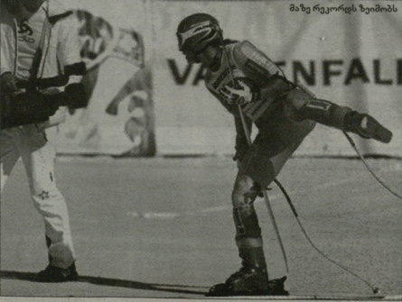
მახ რეკორდის ზეიშობა