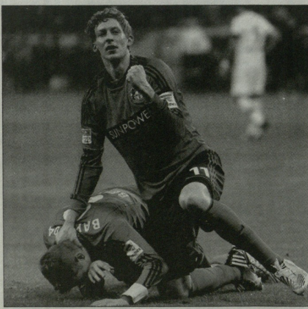
შეგან კოსლინის ანგარიშზე უკვე 16 გოლი და 9 საცოლუ მასია