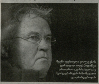
ჩვენი უცხოელი კოლეგების ვარაუდით ვუკუს მიიღვი ვინა-როია, ვის სხელსაც შეიძლება წელის მოძივლი უკვეტო მისი მისი

„პარიზი საბაშის მწვერულზე“ მეთიხველს აუნვა, რომ ველ-მუხედრობის ერთიერთობის დასაბუხვ გამო „როსტონი“ მთავარი მწვერული რავან ბუნდის შესაძლოა მოსტე სეზონის დასრულებამდე დამბოთების და მათის მოლოდინს „სტუმრული მწვერულ“ რუსეთის ნაკრების მთავარი მწვერული ფაბიო კაკალო მოიგვინოს. ასეთ შემთხვევაში 68 წლის იტალიელი პოსტის ფორვარდს მოუწევს, კლუბი სწორედ ამ მომენტს, როკა ველო შეიკავოს. ასეთ შემთხვევაში 2009 წლის თებერვლიან ვუკუს თინკი დანიშნა. პოლანდიელმა ლიბინის ასოციაციის მისი მოიგო და პლუს, ვუნდი პრემიერლიგაში მე-3 ადგილზე გაიყვანა. ამ ტექნიკ რეპლიკა „მანსტერს“ სხვა გვემუბი აქვს. კაკალო რუსეთის ნაკრების არ მარტინოსთან მივყავარ. 22 ბარის ჩრდილოეთ რეკონსტრუქციასთან 2014 წლის მთავალის ჩემპიონატის შესარეფი კლასისა და 25-მის პრემილიათის ამინაფურე დამარტინოსებისთვის. ერთია, მის გვემუბი „რელს“, მეორეა, მისცეს თუ არა რუსული დივიზიონ კონტრაქტზე ამის უფლებას. ამორად ვემუბნებ კაკალო კონტრაქტზე ამის უფლებას. ამორად ვემუბნებ, რომ იტალიელს არ აქვს უფლება მარტინოს პარიზულურად სხვა პოსტზე შეიკავოს. მიღვიკა მავალი უფალია, პოლანდიელს ამის უფლებას ხელშეკრულება აძლევდა. თუცა