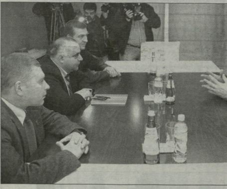
შეხვედრა სპორტის სამინისტროში