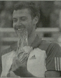
ვულსის მთავარი პრინტი