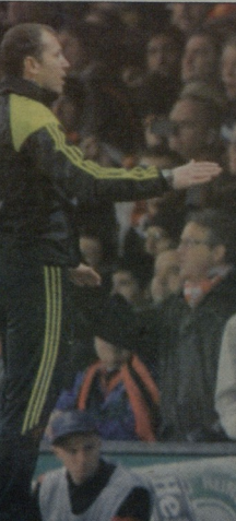
ნანის გაძევებით განინაზღვრული ფრეი