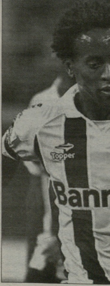
37 წლის ზეპორტსი დიდი მესწავლელი