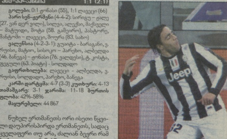
მავარი ანგარიში გასანა