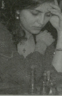
სპორტის ფარგლებში განხორციელდება არსებული პროექტების განხორციელება