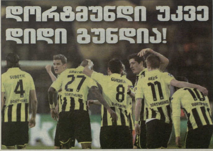
დორტმუნდის ფანბერთი უკვე დიდი გუნდია!