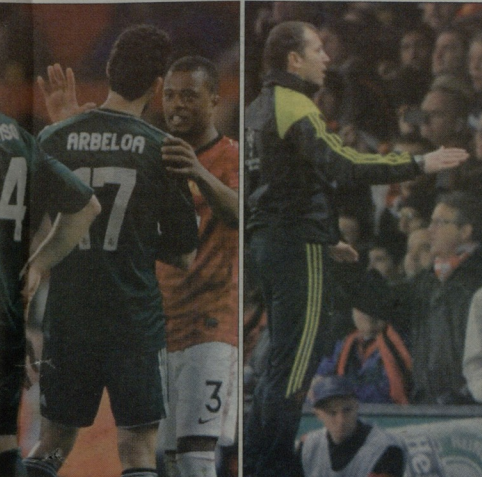
ჩაქირი ჩაქირი მანჩესტერელა გარემოცვაში