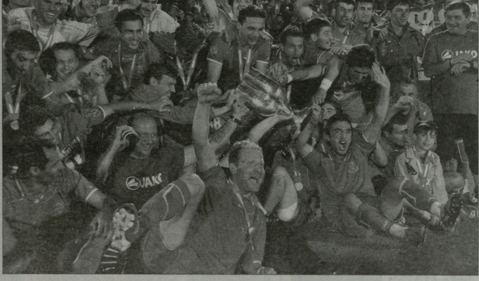
საქართველოს თასის მონაწილე გამარჯვებული გორის დიდა

2012-13 წლების საქართველოს თასის პირველი მეოთხედწლიური მატჩები 13 მარტს ჩატარდება და ითხვე წყველზე დაწვრთვებით იმ დროს მოხდება. საქართველოს თასის მატჩებშია ურთიერთდაბრუნებულსაც ვაგვისტებში და წინდანი ვიტყვით, რომ ცვლადზე დიდ ადგობას არა უმზადლულავალია („დინამო“ - „ჩოხრამი“) და პირისპირისას, არამედ ძველი მონინადლუდებების, თბილისის „დინამოს“ და ლანჩოეთის „გურანის“ ადრინდედ პავერტებზე დაფუძნებით. მანამდე კი მეოთხედწლიურს სტრატეგიკური მონაცემები ვერც შეუვლავალია, ხოლო „დინამოს“ სოფლის თბილისის „დინამოში“ უნდა დაფუძნო სხვა გუნდისათვის მეოთხედწლიურს გაგვლა თუ მიწველა „დინამოსთვის“ წარმატებად, მხოლოდ და მხოლოდ, თასის ატება ჩაითვლება. საქართველოს თასის 9-ჯერ მფლობელი გუნდი 24-ჯერ გათამაშებში მონაწილეობდა და მხოლოდ სამჯერ მოხდა, რომ მეოთხედწლიური ვერ ვაგვიდა: 1999, 2005 და 2012 წლებში; „დინამოს“ მატჩი „გურანის“ მეოთხედწლიური 11-წლიანი პაუზის მერე მოხდა, თუქცა ლანჩოეთის სხვა მიდნეითი შეუძლიათ იმათვის საქართველოს თასის პირველი გათამაშების გამარჯვებულები არიან.