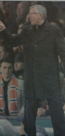
ნანის გაძევებით განინაზღვრული ფრეი