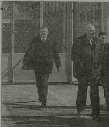
6 მარტს, ავჭალის არასრულწლოვანი კოლონიის სპორტის და ახალგაზრდობის საქმეთა სამინისტროს არასრულწლოვანი და ახალგაზრდა მსვლელებების რესკონდაციის

საბარძელოს სპორტის და ახალგაზრდობის საქმეთა სამინისტროს ახალგაზრდობის საქმეთა დეპარტამენტი მიმდინარე წელს ახალგაზრდული პოლიტიკის განვითარების პროგრამის ფარგლებში ამორტივლებს ქეპპორტის არასრულწლოვანი და ახალგაზრდა მსვლელებების რესკონდაციის ხელშეწყობის პროგრამა, რომელიც მიზანდასახულ არასრულწლოვანი და ახალგაზრდა (26 წლამდე) მსვლელებების პროექტის რესკონდაციის პროექტის ხელშეწყობას სპორტის აქტიური გამოყენებით, არასრულწლოვანი ახალგაზრდის პროექტული (სახელობი) სწავლების უზრუნველყოფით. პროექტის ფარგლებში მსვლელებული დაწესებულებები მოეწყობა სპორტულ ტურირების სპორტის სახეობებში, როგორცაა: ფეხბურთი, ქუჩის კალაბოჭო, ფრეზბურთი, გულბურთი,