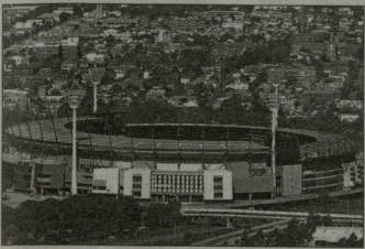
მებურნ კრიტკ გრანდუ ლივერპული პრინცალ დილინი ითამაშებს

„ლივერპული“ 2013/14 წლების სეზონისთვის მოამზადებულ შეკრების იგლისნი დინტებს და „მელედში“ რამდენიმე დღის გატარების შემდეგ, Liverpool Daily Post-ის ცნობით, ავსტრალიაში გაგრძელდება. „ნიტლავი“ კლუბის მფლობელი პირველად ითამაშებენ სახელმწიფო მებურნ კრიტკ გრანდუ ავსტრალიაში „ავტორის“ წინააღმდეგ. 100-ათასობის არენა 1956 წელს ოლიმპიადის უმასპინძელი, 2006-ში კი დიდი ბრიტანეთის ოლიმპიადისთვის ითამაშებდა მთავარი სტადიონი იყო. მერსისაიდელი დიდებული წყნარ ნიტლავი იტალიური იმპორტული, სადაც ვიზიტი კი დიდად, მაგრამ სპორტული თარიღები ვერ კიდევ უკნობია. ავსტრალიის ფეხბურთის ფედერაციის პრეზიდენტი ენტონი დი