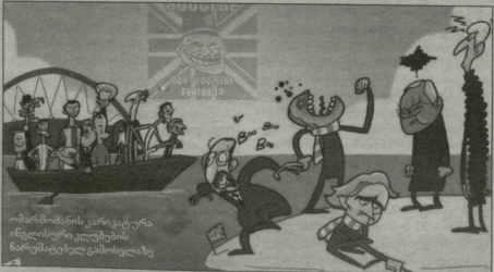
ომირომონის კარიკატურა ინგლისური კლუბების წარმომადგენლებს

ჩინური მტოხვებმა უკვე იცის, რომ პირველად 17 წლის განმავლობაში ჩემპიონია ლივის 1/4-ფინალი ვერც ერთი ინგლისურმა კლუბმა ვერ გააღლია. „მანჩესტერ სიტი“ და „ჩელსი“ პლეი ოფიცის კერ ვაივინენ, „მანჩესტერ უნიტედში“ და „არსენალში“ კი 1/8-ფინალი დაპირრეს უკმაშეცხა. ნაფრებლობაში პრემიერლიგის დეფის კონკრეტებების ცნობილი პირადი ადგილი დაკავრდება, რამაც ინგლისურ პრესა უკვე ალაპარაკა. მიმდინარე სეზონი ინგლისის ჩემპიონატმა 84,410 ქულით ოლიფრის რანჟი დაიწყო. მისი უპირატესობა ესპანეთის (84,186) მიხედვით გახლდით. მათ გერმანია სოლიდარად ჩამორჩნობდა (75,186), მაგრამ დღეს რეალიმ უკვე სხვაგვარაა. ინგლისის 79,829 ქულით შერია, „დორმუნდის“ და „ბაიერის“ წარმატებებმა კი გერმანიის რეიტინგზე დადებითად იმოქმედა. ბუნდესლიგის უკვე 76,757 ქულით ავსტრიის „რაპიდს“ გათვლით, აგრამოხუბი ტანტებს მანხი აქვთ, ინგლისის პირი მოხიციავ ნაროხით. თუმცა ურთულელების მეგობარობა უმდიდრესი სახელედაც ვერ ურდობენ. პრემიერლიგის პრესტიჟის