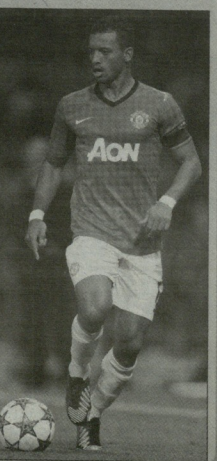
მამარი მოხუხადა ლეან ბიროლასი

„მანჩესტერ ინიანიუსი“ 26 წლის პორტუგალიელმა ვარგამარმა ლუიზი ნანი აღარა, რომ მიმდინარე სეზონში გერ თამაშობის იხი დონტზე, რისაც მისგან წინაშეხედილები ითხოვენ, მაგრამ იმდენი გამოუტყვებენ, რომ სეზონის დასრულებამდე მუხეცხა მისი მამტეკიცება, რომ ადელს შეხედობს. სონის ვერ კიდევ შეუძლია მისი დედა და, შესაბამისად, ლარს მისთვის კონტრაქტის ვანხვარდლებია. მართალია, ლუიზი ტრანკლები არუხედა, მაგრამ ის არ ამტკიცებს მის სტატისტიკას: ჩემპიონატის 10 შეხვედრაში მის ანგარიშში 7 გოლი და 3 საგოლე გადაცემა. „ფორმის“ ინგ-წელი შევადგინა და მისდა დეაბტეკოე, რომ ვიზობაზე ვერცხეზებენ ნიბობას. – ვანხვება პორტუგალიელმა. ნანის ხელეკურლებას ვადა 2014 წლის ნახუშურმა გახვლეს და შესაძლებელია, სეზონის დასრულებისთვის აუნიტეტებმა ის ტრანსფერზე დადგინოს.