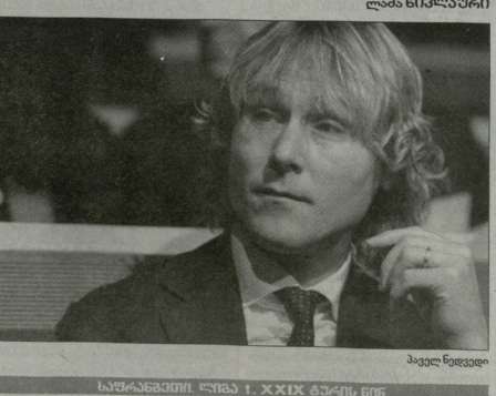
სალვადორი. ლამა 1. XXIX მარტი, 15 მარტი