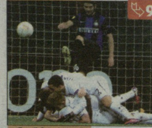
ინტერს მეოთხედღინაღამე ცოტა დაღღა