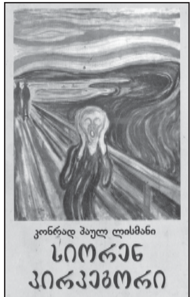
კონრად პულ ლისმანი სიორენ კირკეგორი

წიგნი თარგმნა ცნობილი ქართველი ფილოსოფოსი ვიქტორ რცხილაძემ. მას ქართველი მკითხველის წინაშე წარდგინება არ სჭირდება. ამ ბოლო ათწლეულების განმავლობაში მან არაერთი გერმანელი ფილოსოფოსის და თეოლოგის თარგმნება გადმოქართულა.