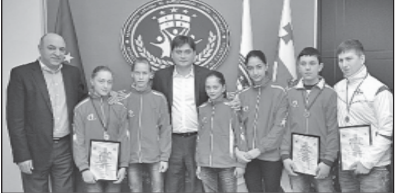
ჩვენს დელეგაციის მეთაურები და მონაწილეები მინსკში გამართულ ტურნირში.