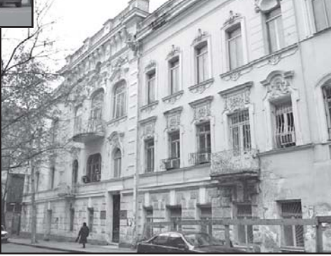
ნელობის ხელოვნება აურა დღესაც უნათებს გზას ახალგაზრდებს, რომლებმაც უნდა გააგრძელონ იმ ქვეყნობის ტრადიციები, რომელთა ბეჭეებს ეყრდნობოდა ქართული შემოქმედებითი სამყაროს ცის კაბადონი...