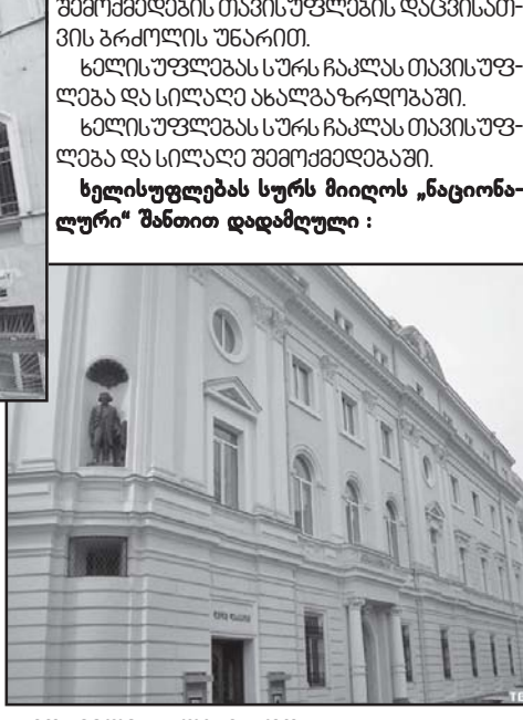
მორჩილი ახალგაზრდობა; ეროვნული სულგამოცლილი ხელოვნება; ქვეყნის გადარჩევის ნიშნულზე დადგენილი საზოგადოებრივი პირობები...

ბათუმში გოგებაშვილის ქუჩის ნახევარს უნდა ბაქოს სახელი; ბათუმში ერთ-ერთ მოედანს უნდა დამკვირობელი სულთანის - აზიზის სახელი;