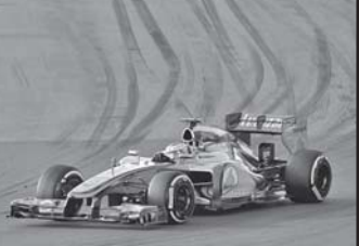
„სეზონის დასაწყისში გაბარჯვება კალაზა მნიშვნელოვანია, სეზონი კალაზაში უნდა დაიწყო, ჩვენ კალაზაში უნდა ვიყავით უახლოეს პრინციპში“ - უთქვამს ფინიშის შიმპლეტ ბატონს.