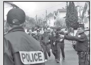
ავსტრიაში გააუფლებლეს მამაკაცი, რომელიც გამგეობას ეწინააღმდეგებოდა...