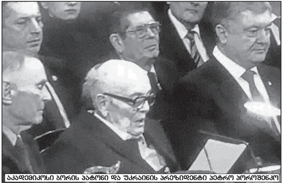
აკადემიკოსი ბორის პატონი და უკრაინის პრეზიდენტი პეტრო პოროშენკო

რდით დაუდგე ჩემს ერთგულ უკრაინელ კოლეგებს. ამის გარდა, თბილი ურთიერთობა მაქვს აკადემიის პრეზიდენტთან, აკადემიკოს ბორის პატონთან, და ბოლოს, მე უნდა ვყოფილიყავი ამ დღესასწაულზე, როგორც ვერნადსკის სახელობის ოქროს მედლის კავალერი, რომელიც ითვლება უკრაინის მეცნიერებათა ეროვნული აკადემიის უმაღლეს ჯილდოდ და რომლითაც დამაჯილდოვეს 2017 წელს მასალათმცოდნეობის სფეროში შესრულებული პიონერული სამუშაოებისათვის. აქვე მკითხველს შევხსენებ, რომ აკადემიკოსი ვ.ი. ვერნადსკი (1863-1945) იყო უკრაინის მეცნიერებათა ეროვნული აკადემიის დამაარსებელი და მისი პირველი პრეზიდენტი. იგი გახლდათ უდიდესი მეცნიერი მინეროლოგი და კრისტალოგრაფი, ბიოგეოქიმიის მამამთავარი, რომელმაც პირველმა განიხილა არაორგანული მეტერიალური სამყარო და სიცოცხლე, როგორც ერთიანი სისტემა, და დასაბამი მისცა მომავლის უდიდესი მეცნიერული მიმართულების – ნეოსფეროს განვითარებას.