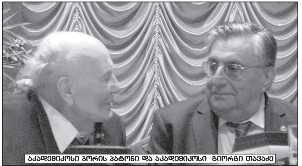
აკადემიკოსი ბორის პატონი და აკადემიკოსი გიორგი თავაძე

ყოველივე ეს აისახა ადამიანის საცხოვრებელ გარემოზეც. XIX საუკუნის მეორე ნახევარში პირველად გაჩნდა ფოლადის სამშენებლო კონსტრუქციები ხიდების, კოშკების, ანძების, კარსული ნაგებობების და სხვათა სახით. ასეთი კონსტრუქციები მრავალი სვემენტისგან შედგება და თავდაპირველად ადგილზე აიწყოობდა ქანჩუბითა და ჭანჭიკებით, უპირატესად კი მოქლონებით. ამ ტიპის კონსტრუქციას ეიფელის კოშკი, რომელიც დღესაც საინჟინრო აზროვნების შედეგად ითვლება. იგი პარიზს ამშვენებს, აგე-