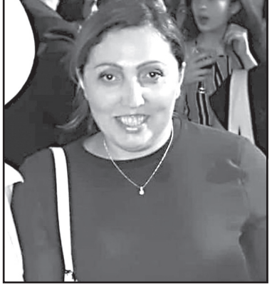
ლაც სხვა მექანიზმია მოსაფიქრებელი, რომ დაბალანსება მოხდეს და კონტროლის მექანიზმი იყოს?

— ისაუბრებთ დამოუკიდებლობაზე, მაგრამ მნიშვნელოვანია გამოიხატოს ეს მართლმსაჯულების ხარისხის გაუმჯობესებაში, რასაც ვერ ხედავთ. ხომ არ ფიქრობთ, რომ რა-