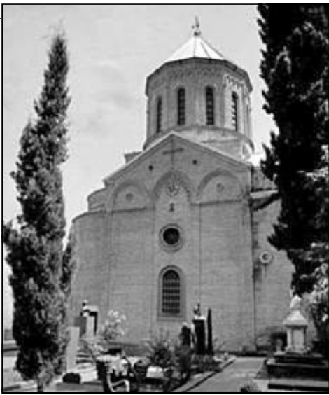
მოიხსენიება. ის იერუსალიმის ეპისკოპოსი იყო.

წმინდა იაკობ მოციქული იოსებ დამწინდველის შვილი იყო პირველი ცოლისგან და ამიტომაც, სახარებაში უფლის ძმად