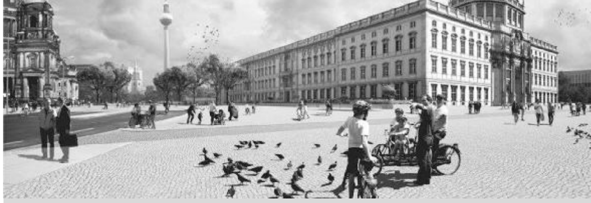
ეს, ალბათ, მხოლოდ გერმანიაში ხდება: ქვეყნის წინსვლამ ის საბედისწერო ზღვარი თითქმის უკვე წაშალა... „ბერლინის კედელი“ კი ისტორიულ რეალიად დარჩა

ლიად გამოდიოდა რეჟიმის წინააღმდეგ, გორბაჩოვი უზრალოდ უხერხულ მდგომარეობაში ჩავარდა. ორ დღეში ლაიპციგშიც დაიწყო გამოსვლები, მერე აღმოსავლეთ გერმანიის სხვა დიდ ქალაქებშიც. 1989 წლის 18 ოქტომბერს პონევერი იძულებული გახდა გადაემდგარიყო. მან მოსკოვს შეაფარა თავი, თუმცა, ჯერ კიდევ 7 ოქტომბერს რესპუბლიკის სასახლის დარბაზებში ის სრულიად დარწმუნებული იყო თავის ტრიუმფში, „სოციალიზმის უძლეველობაში“, გდრ-ისა და საბჭოთა კავშირის „მარადიულ ძმობაში“.