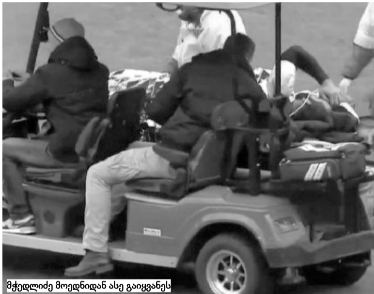
მჭედლიძე მოედნიდან ასე გაიყვანეს