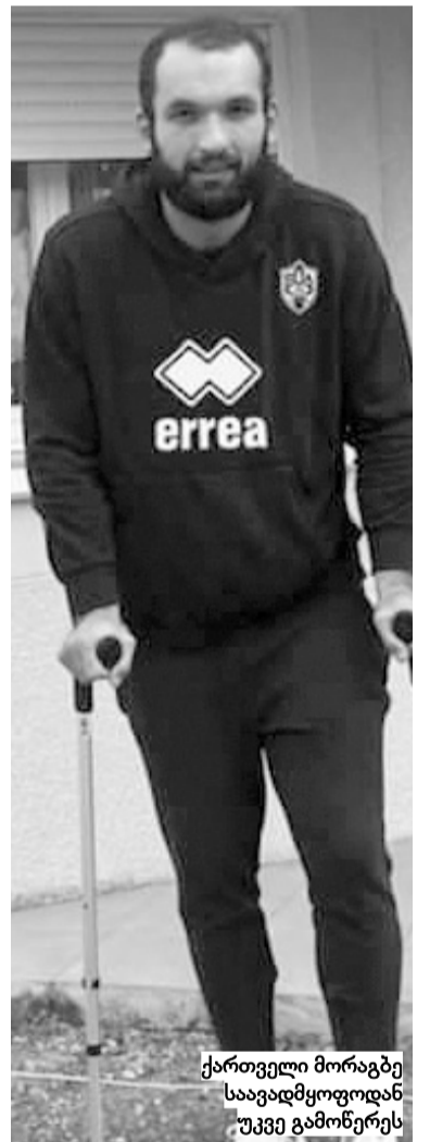
ქართველი მორაგბე საავადმყოფოდან უკვე გამოწერეს