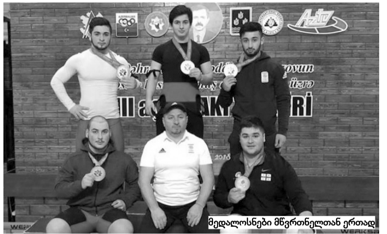
მედალოსნები მწვრთნელთან ერთად