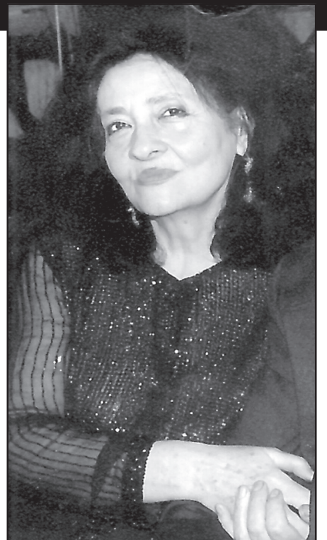
ქართულმა ინტელიგენციამ დიდი დანაკლისი განიცადა – გარდაიცვალა სამედიცინო დარგის გამორჩენილი მეცნიერი, პროფესორი

ქალბატონი ჯილდა მთელი სიცოცხლის მანძილზე ერთგულად ემსახურებოდა ქვეყანას და ხალხს. მსუბუქი ყოფილიყოს მისთვის ღირსეული მამულიშვილისთვის მშობლიური მიწა.