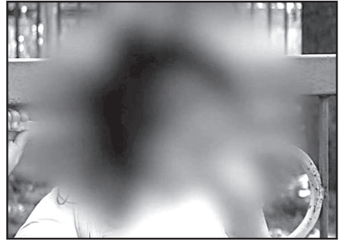
ლე დროში შეძლო და ის ბრალდებულის სტატუსით თბილისში დააკავა.

გამოძიება სისხლის სამართლის კოდექსის 150-ე და 157-ე მუხლებით მიმდინარეობს.