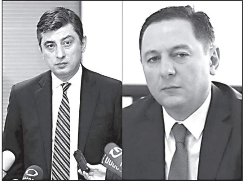
ის მისაღება ბიძინა ივანიშვილისთვის.

ქვეყნის მთავარი მეოცნებე მთავრობაში სერიოზულ ცვლილებებს ამზადებს. „ოცნების“ შემქმნელის მთავარი სამიზნე ამჯერად ძალოვანი სტრუქტურებია. არადა, ჯობდა, ეკონომიკური გუნდით დაეწყო. ეკონომიკის მინისტრის განცხადებები უკვე არანაირ ჩარჩოში აღარ ეტყვა.