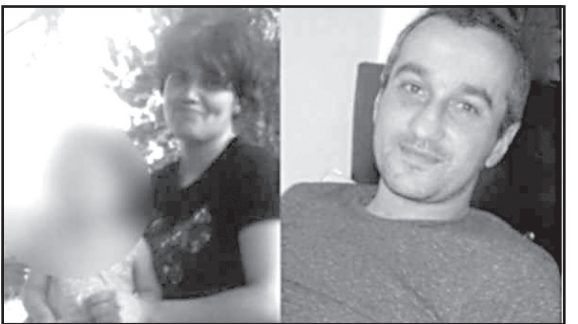
სის დარღვევას გულისხმობს, რამაც გამოიწვია ორი ან მეტი ადამიანის სიცოცხლის მოსპობა.

შინაგან საქმეთა სამინისტროს ინფორმაციით, გამოძიება სისხლის სამართლის კოდექსის 276-ე მუხლის მეშვიდე ნაწილით მიმდინარეობს, რაც ტრანსპორტის მოძრაობის უსაფრთხოების ან ექსპლუატაციის წე-