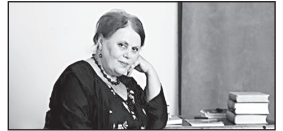
როცა კლავენ და ამტკრევენ. ეს ცოცხალი არსებები ჩვენგან ელიან შევლასა და დახმარებას და დახმარება და მოვლა უნდა შევძლოთ, უნდა გავუგოთ მათ, უნდა ვიცოდეთ ისინი, უნდა შევისწავლოთ. სამყაროთი ალტაცება, მისდამი მონინება, მისი სიყვარული უნდა იყოს მისი შესწავლის წინაპირობა, მან უნდა მომანდომებინოს მისი შემეცნება.

ცხოველები და მცენარეები ჩვენი უმცროსი დები და ძმები არიან... ზნესრულმა ადამიანმა თავისი გული და სული, ზრუნვა და ფიქრი მთელ სამყაროს, ყოველ ცოცხალ არსებას უნდა გაუწაწილოს. ყველაფერი ცოცხალია, ვარსკვლავიცა და მცენარეც, მათაც სტიკივით,