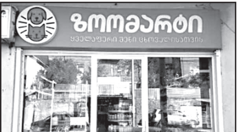
ამოღებით, მინიმალურ დონეზე იქნება უკუკავშირი/ყურადღება, წარმართება ეფექტურად, გონივრულ ვადებში და მოიტანს კონკრეტულ შედეგს, – აღნიშნულია მალაზიის ინფორმაციაში.

2019 წლის შობა დღეს, 7 იანვარს გვიან ღამით ჩვენ ქურდობის შედეგად კიდევ ერთხელ დაზარალებით. ამჯერად, ზარალმა შეადგინა 13.000 (ცამეტი ათასი) ლარი. იმედს ვიტოვებთ რომ გამოძიების პროცესი ამჯერად მიტანს ალარ შემოიფარგლება მხოლოდ ვიდეო ჩანანერების