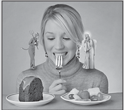
მხარვა არასწორი კვების შედეგია

ნარკვით, ინტენსიური ტიპიური მკერდში, თავბრუხვევა, ძნელი ყლაპვა, ორგანიზმის გაუწყლიანება და წონის უშიზაჟო დაკლება. ექიმნი დანიშნავენ ბამოკვლევას: რენტგენოგრაფიას და საყლაპავი მილის, კუჭისა და წვირილი ნაწლავის ენდოსკოპიურ ბამოკვლევას, შემდეგ კი შეარჩევს მკურნალობის ძირითადი დაავადებისთვის, მგაბლითად, გასტრიტისთვის.