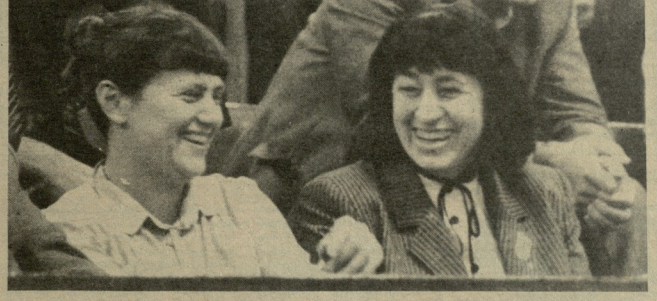
სსრ კავშირის 51-ე ჩემპიონატი კალათბურთში

სსრ ცენტრალური კომიტეტის ვენერაბული მდივნის, სსრ კავშირის უმაღლესი საბჭოს პრეზიდიუმის თავმჯდომარის ი. ვ. ანდროპოვის განცხადებაზე, რომელიც გულსუფროთი და ამავე დროს მკაცრი და სამართლიანი გამოცხადება. დას. ზოგჯერის ბუნებრივი მრავალი დღეობა აღბინი მხოლოდ დღეობის მკონია, არაფრად მიაჩნია კაცობრიობის ბედი, ავიწყდება, რომ მასზე მწვედობისმოყვარე საბჭოთა ხალხი ცხოვრობს. სოციალისტური ქვეყნების ხალხები ცხოვრობენ, რომლებსაც არ სურთ ახალი დიდი ხანძარი, არ მოსწონთ ოკეანისგამდამალი იარაღის ელმარები.