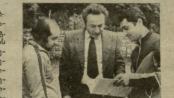
სპორტის სპორტის სპორტის... 1971 წელს საბჭოთა კავშირის...