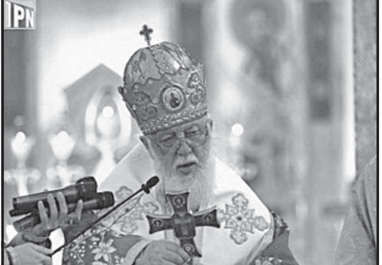
ამის შესახებ საქართველოს კათოლიკოს-პატრიარქმა, უწმინდესმა და უნეტარესმა ილია მეორემ პეტრე-პავლობის დღესასწაულთან დაკავშირებით სამების საკათედრო ტაძარში ქადაგებისას ბრძანა.