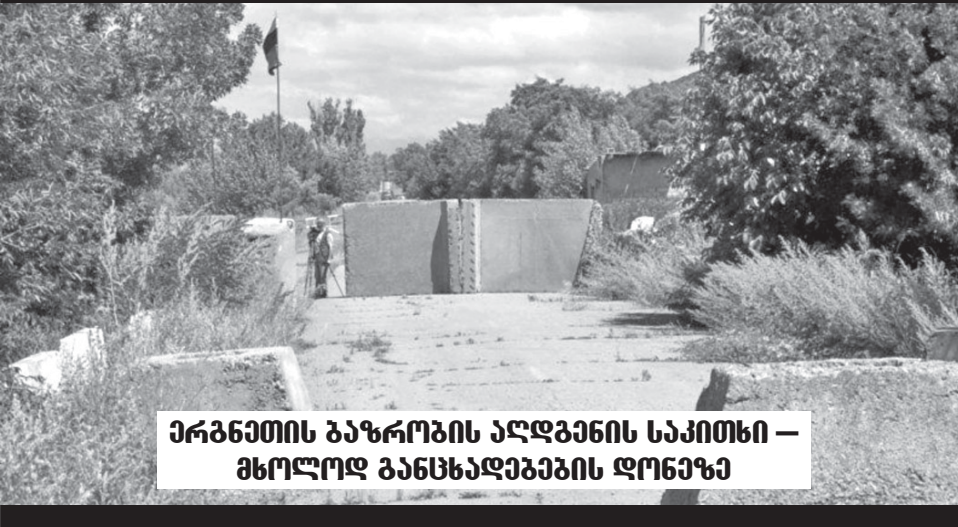
ერგნეთის ბაზრობის აღდგენის საკითხი - მხოლოდ განსხვავების დონაზე

მისი აზრით, ისეთი ბაზრობის გახსნა შესაძლებელია, სადაც მხოლოდ სოფლის მეურნეობის პროდუქტები გაიყიდება. სანაქოვის განცხადებით, ოპონენტული ტერიტორიების მიხედვით საქართველოს სტრატეგიულიდან გამომდინარე, ქართული მხარე მზადაა, ნებისმიერ ადგილზე შექმნას საბაზრო ტერიტორია, სადაც შეიძლება განხორციელდეს ბაზრობის აღდგენის სამუშაოები. მისი თქმით, ბაზრობა მაშინ ლეგალური იქნება, თუ იქიდან გამომდინარე და საქართველოს ბიუჯეტში დიდი რაოდენობის თანხა შექმნდება. მაგრამ 2003 წლიდან, როცა ერგნეთის ბაზრობის არაკანონიერებაზე დაიწყო საუბარი, საქმეში მართლა ჩაერთვნენ კრიმინალური ელემენტები და რუსეთიდან სატივითო მანქანები ბაზრობის გვერდის ავლით შემოჰყავდათ, სხვა ადგილებში პროდუქტია ქართულ მანქანებზე