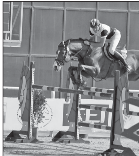
ასპარეზობის უფლება შექონდა. ძირითადი შეჯიბრება უკვე დასრულდა. ბაქოში მასტერსზე მონაწილეობა მონაწილეობა მონაწილეობა მონაწილეობა

ბაქოში გამართული ცხენოსნობის საერთაშორისო ფედერაციის ეგიდით დაბრკოლებათა გადალახვაში „ბაქოს მასტერსი“ გამართა, რომელიც „ეკსპრესის ლიგის“ 2012-2013 წლების მესამე ეტაპი იყო. შეჯიბრებაში მასპინძლებთან ერთად საქართველოს, გერმანიის, თურქეთისა და ირანის მხედრებიც მონაწილეობდნენ, თითოეულს ორი ცხენით