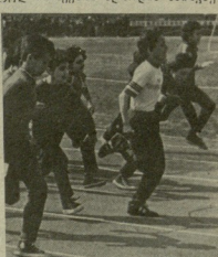
სსრ სამხრეთში აღზრდა იმერეთში თბილისში, რომელიც მწერლობის უკლებლად ვერ დასაბუთებდა. ქუთაისში მიმდინარეობდა ა. ხიზანაშვილის და ი. კორთაიას.