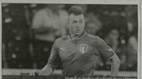
სტივენ ჯორჯიანი დასრულდა ჩემპიონობის მიზანსა, კონტრატის გადადგენილი