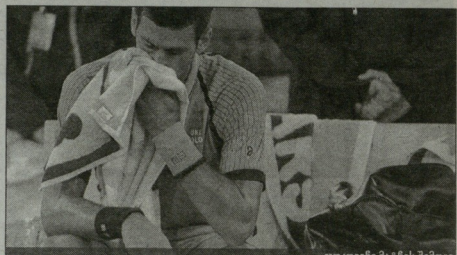
ჯოკოვიჩი მატჩის შემდეგ

ძალის სუპერტრენინის შემდეგ, მადრიდში საინტერნო ფაზაში შევიდა კაცების მასტერსი - იქ დაიწყო მცირე სრე და შესაბამისად, ბრიტანმა ჩაენგნ მართალი ფაგორტები, ერთსთვის ამ რაუნდში მატჩი სადღესასწაულოდ. მარნადელ სეზონშივე ნოვაკ ჯოკოვიჩი კარგად თამაშობდა მადრიდის გრუნტზე. 2009 წელს, მან ოთხსაათიანი ნახევარწლიანი ნაყო რეგულა ნადლთან, ორ სრეში (2010 წელს ესპანეთის დელდაკლუნი არ ჩასულა) გადახვევტ მატჩი დაამარცხა რაფა მარინს ნოვაკ ტიტლთან დაცვას აპირებდა, მაგრამ მოლოდინულ ნაყო მსახურნი.