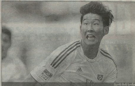
კინი შინ სონი

ამსტერდამი ათასის 21 წლის დაწილი შემცვენი ნახვარცვლი კრისტოტან ერისენი "დორტმუნს" მიმართებში ამ დღედაც მოხიზნობს, რომი ცივტცეს ტრანსაფერი იფიციაციად დადასტურდა. აღსანიშნავია, რომ "ბორუსიას" ახალდამამცხვარი ჩემპიონის ლიდერს ფიქრი დიდი ენახლბი, "რეალ" და მანჩესტერ უინიტივ-