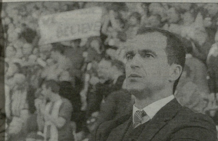
უიგანის გულშემატკივარს საკუთარი გუნდის ვერ ვიდევ სჯერა