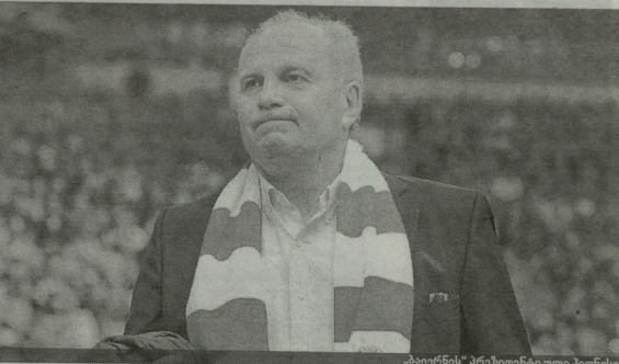
პაიერნი" პრეზიდენტი ჟლი შიონესი