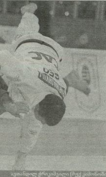
ავანსიდი ტრეპიკალი (მედიკოსი)