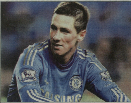
ფრანდო ტორენსი აქცეს დასრულებული საკლუბო სერიაში მაღალ დონეზე ჩაატარა

ფრანდო ტორენსი სტრემფორდ ბროუზე 2011 წლის იანვარში დაიწყო. მან მერე ვულვეტკატის ესპანელი მწოდელი გრიტი სასაველოე აქცეს. „ეს ნინოს“ ცოცხა გოლი გააკვს, თორემ მორიგობებსა და გუნდისთვის თვითღმინებს მას არცერთ უარსაც ვერ ტყუილს სასაველოე ნაბიჯიდან აქცეს თავად წარმოდგინეთ. 29 წლის თავამ-სხელმა მთავრე წრეში პრემიერლიგაში მხოლოდ 1 გოლი გააკვს. „ვეტრომ-დე“ მწოდელი სერია 18 შეხვედრა გაგრძელდა. უკანასკნელად ტორენსი 23 დეკემბერს ასტონ ვილასთან (8:0) შეხვედრაში უკანადა გატანლი. მერისიად-ლივობაში მატჩში ესპანელმა ინგლისის ჩემპიონატში თავისი მე-8 გოლი გააკვს. მიმდინარე სეზონში ტორენსი საკლუბო დონეზე 64 თამაში ჩაატარა, 22 გოლი შეაგდო და 11 შეხვედრა გადაკვს-მა შესარულა. აქედან 8 გოლი და 3 პასი ჩემპიონატში. ამას დაემატა 2 თამაში ესპანეთის პირველი დივიზიონის 67 შეხვედრა „ეს ნინოს“ აქმიდე არს-