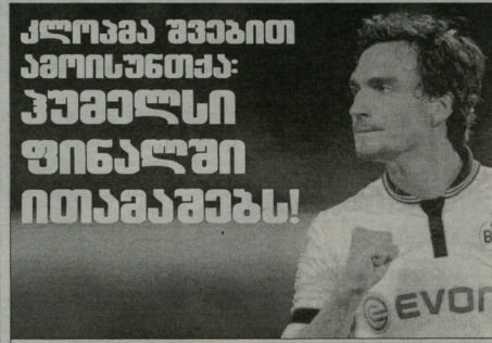
მატს მუხლიან ბაიერისთან ითამაშებს

ფორტმუნდის „ბორუსის“ ქომაგებს შაბათს, ბუნდესლიგის 34-ე ტურში „პოფენჰაიმთან“ ნაგება ოლნაგადეც არ აღუდგებოდა - მათი მწირთელის მიზეზი დღევს პირველ მატჩს ბუნდესლიგის ტრავმა გახლდათ. 24 წლის მკველ 75-ე წუთზე დაბადე და შესაფუთი გახდა, მატჩის შემდეგ კი ვარჯილდა მწერი, რომ დღეს მანსი იყო, ბუნდესლიგის წინააღმდეგ გამთავრებოდა.