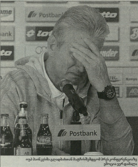
იუპ ჰანკესმა გლადბახთან მატჩის შემდეგ პრესკონფერენციაზე

სამწირთელი კარიერაც „გლადბახში“ დაიწყო და ბუნდესლიგის სწორედ მონხენგლადბახშიც ემედიოვებოდა. ამ ქალაქთან და ამ კლუბთან მეორე ტრიუმფი, მარცხი და რამდენიმე კუროიზი მაკავშირებს. მინდა, „ბაიერის“ ფანებთან ერთად, ასეთი თბილი გამოხატულებებისთვის მადლობა „ბაიერის“ ქომაგებსაც ვაფუთავებო, რადგან... - აქ ჰანკესის სიტყვა ეფუძნება, მისი სახე ცერემონიაში გადასწავლა ნინადგდება დასრულება. აღნიშნავს მთავარბრძოლად შეძლო. ეს კიდევ ერთი დასტურია იმისა, რომ ჩემი სამშობლო აქ არის... -