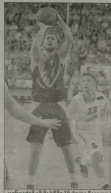
ინცაძემ ამ მატჩში 15 ქულა ჩააგდო

გიორგი მინაძის კარიერაში პირველი გუნდის უკრაინის ჩემპიონატი მოელოებინა, მაგრამ მისი აზოვზაზაში სტრუქტურა დაზოვზაზაში მიმდინარე სეზონით, 95% დამოუკიდებელია. სერიაში ანგარიში გათანაბრდა - 3:3. გადაწყვეტი, მეშვიდე თამაში კიბეში, აზოვზაზაში მოდანზე 31 მათის გაიმარჯვება.