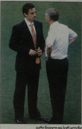
გარი ნევილი და სერ ალექსი

მანჩესტერ ინაიტედის ყოფილი კაპიტანმა გარი ნევილმა საკლუბო ვებგვერდს ინტერვიუ მისცა, სადაც იმ განცხადებით განაცხადებდა, რომელიც ბოლო პერიოდში ინტერესს უჩვენებდა მისად. 38 წლის ვეტერანი მოთხოვნის კლუბის მომავალ იმედებად აღიარებდა.