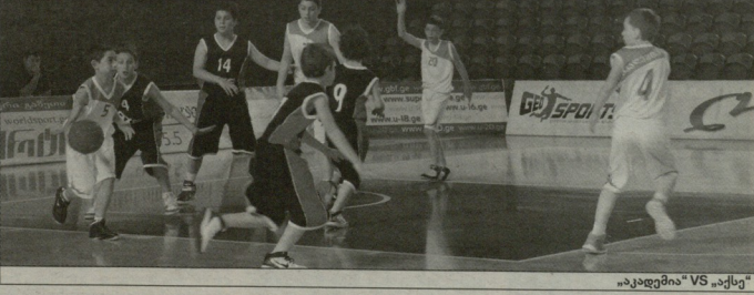
აკადემია VS აკუსი

გუნდში მებედრები ასე დასრულდა: სოსოში-თსუ 32:25, აკუსი-თსუ 50:38, დანამი-ზესტაფონი 48:19, აკუსი-თსუ 49:23, აკარინალი-რუსთაში 48:43. როგორც თბილისის კალათბურთის განვითარების კავშირის პრესტოლში ვეჯიონი, 1 ივნისს ბათუმა საერთაშორისო დელსანა დაკავშირებით გამომარჯვა ერთდელს საკალათბურთო მართო, რომელიც მონაბედიანს მიიღეს გუნდი (თითოში 12 კალათბურთელი). ასევე გამომარჯვა შეხვედრა 16 გუნდის მონაბედიანს (თითოში 12 მოთამაშე).