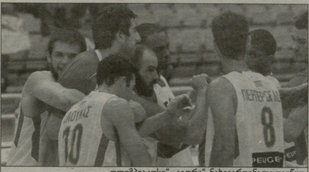
ოლიმპიკოსი აკადემია, ნახევარფინალი დანიყო