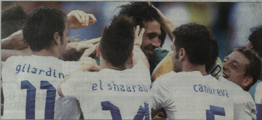
იტალიელებს ვივივი მოაგებინა