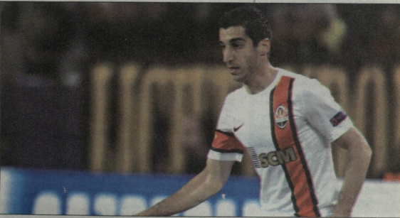
პერნის მხითარიაანს ლივერპულსა და ტორტენუმს უარი შეუთვალა

უკვე არავრთხელ ვაგუნეო, რომ გერმანიის გოცემეშირი და ჩემპიონია ღონის ფინალისტი დორტმუნდის „პორუსია“ ოლივეკუს „შახტარის“ სომეხი ვარსკვლავით, პერნის მხითარიათა დონიტრეტულად - გერმანულ და უკრაინულ გრანდებს შორის უკვე პირველი მოლაპარაკებაც შედგა, რაც ორივე მხარემ დაადასტურა.