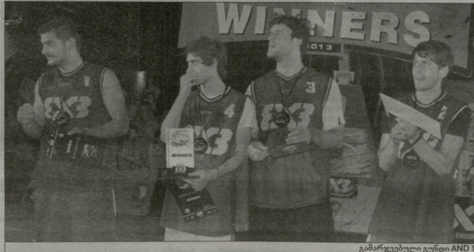
გამარჯვებული გუნდი AND 1