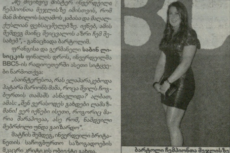
ბარტოლს საპასუხო სვლა