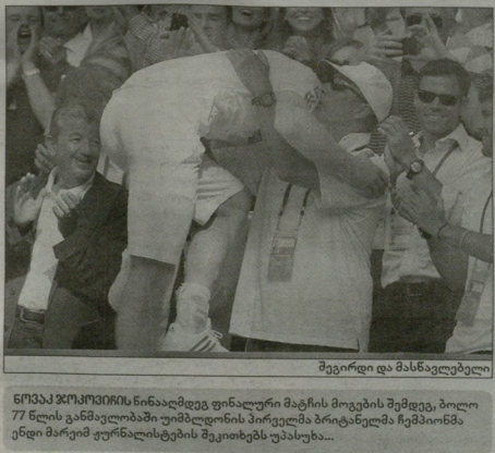
შეგერი და მანსაფელი