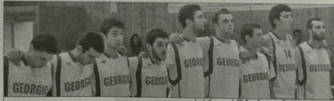
საკრებოლის 20-წლამდლია ნაკრები იტალიაში