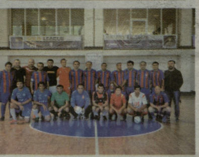
SPORT BUSINESS MANAGEMENT GEORGIA

ფინალური შეხვედრის წინ გამართა ამბანაგერი შეხვედრა, რომელშიც ერთმანეთს ლიგის სიმბოლური ნაერბი და მინი-ფეხბურთის ეტბარები დაუპირისპირდნენ ერთმანეთს. ეტბარებმა მამია არ დუეტეს მეტოქეს, თუმცა უნდა ითქვას, რომ თამაშის მსვლელობისას უპირატესობას ლიგის ნაერბი ფლობდა, ხოლო კართან შექმნილ მომენტებს მათი მეტოქე გუნდი იყენებდა.