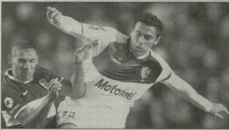
ვიტორ აკინოს შესანიშნავი დაბრუნება გამოვიდა