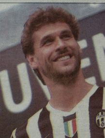
ფინანსური ლორენტე ახალ ცენტრშია ვერ ვერ შეეცა