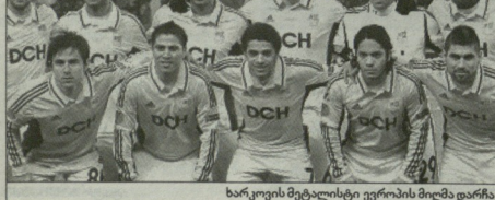
ხარკოსის მეტედილი ვერობის მიღმა დარჩა

21 და 27 აგვისტოს „მეტედილს“ გერმანიის „აქსელსთან“ პრედიტის რაუნდში უნდა გაერთიანო, რომელი გუნდი გადავიდა რეგისტრაციის ვაჭუ-