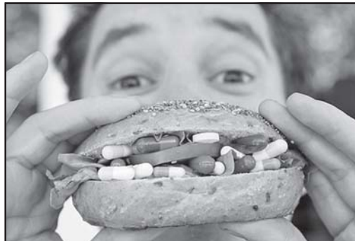
სტრალიისა და აზიის დანამატების გამოყენების შესახებ დასკვნები ადგილობრივად მუშაობდა ტვინში, მათადაც მუშაობდა ადგილობრივად მუშაობდა ტვინში.

2004 წელს აშშ-ს საუბიჯოტონის უნივერსიტეტში ბანახალს აქვს და დასკვნა გამოაკეთა, რომ ბავშვის საკვებში დანამატების გამოყენება არ ღვამდა ბავშვებს და მნიშვნელოვნად გაუმჯობესდა.