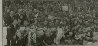
კანადა მოქმედი ჩემპიონია