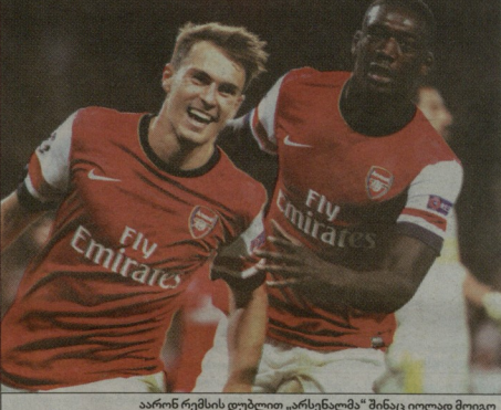
არსენალის დუბლი „არსენალს“ შინაი ილიად მოიგო