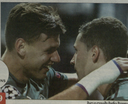
მალკოლოგაი მანცე შევიდა

აოჯსონის სიურპრიზები ინგლისის ნაკრების მთავარმა მწვრთნელმა გვამდგენლობა დაასანაღა