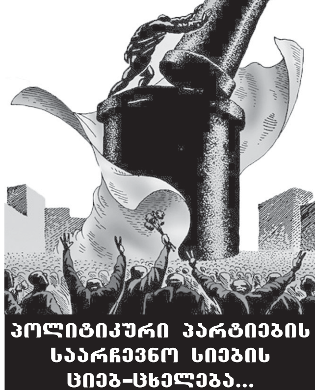
პოლიტიკური პარტიების სარჩევნო სივრცის სივრცე-სხელება...