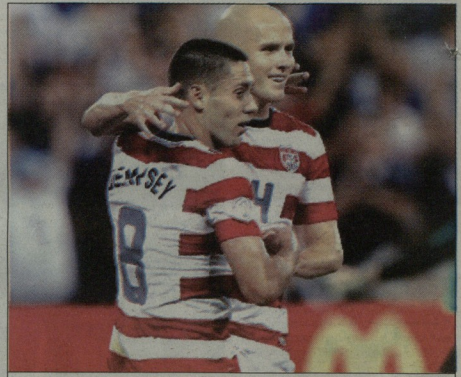
ამის ნაკრები მუნდიალზე მეათედ ითამაშებს