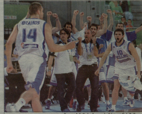
მაიკლ ბრანდის ბოლო სამქულიანი შემდეგ

ესაბრუნო, ხოსესა, კაიპა, კოკოლე, ბურუსისა, საბურთისა (ორჯერ) და ისე კაიპოკოლე მცირე მოთხრობის შვიდი სამქულიანი ჩაგვდა, რამაც ბურთებს მისი გასვლის საშუალება მოსცა - 40:34. დღე შეტყვისთვის ესპანეთმა შეძლო სტაბილური სამ ქულად შევიკრძალა, მაგრამ უკვე მინიმალური, რომ მისი სანტიმეტრი მინიმალური გვეყოლოდა.