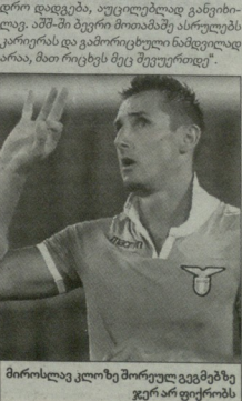
მისიროსად კლონა მწვრთნელ გეგმებზე ჯერ არ ფიქრობს

არმი-არმი წინა წინაში გახდებოთ რომ „ლავიკოს“ მწვრთნელებს მისიროსად და მისიროს ახალ კონტრაქტს ანახებენ. აბეკ ვეჯითა, რომ 35 წლის გრანდიულ ფორვარდს რომაულ კლუბში რეარტის ვარიანტს მთავრად ზაფხულს ეწერება და ჯერ კიდევ არ გაუფუტვებია, სად გაავრცელებს კარიერა - არის ვარიანტი, რომ სულაც უფლები სეზონზე ჩამოვიდეს. საინტერესოა, რას ფიქრობს ამ ევროფორმაზე თავად კლონა - აბეკი მისი კონტრაქტი: „ჯეროვებითი, მთელი ჩემი ფიქრები ალავიკოს“ ასპარეზობას და ვაფხულებს დავებოლ მუშაობას უკავშირდება. სიამარვე გითხრობ, ამაზე უფრო შორს ვერ ვფიქრობი არა, იმედი უნდა არავის ვეცი. სადა გაავრცელებს პარკიერებას ამ ტემპზე, არც ვაფიქრობ დასრულებას მწვრთნელ და ვეჯისაბადა, საინტერესოა ვერცხეის გეგმებით. ერთი ფიქრია, ამერიკიდან არი მადეკერი ნინადადგმა მივიღე და როდესაც ამის