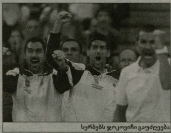
სერებს ვოკოვინი გაუძღვება

ამ კვირას, მამაკაცთა ტურნირები არ იმართება, რადგან დადგენილია დევისის თასის ნახევარფინალური მატჩები. სწორედ ამ უქმეზე გარიკვევა ამ ტურნირის ორი ფინალისტი, არაბული მოქმედი ჩემპიონი ჩეხეთის ნაჯრები არაენტირას უმასნიძლესს, ბელარუსი კი სერბეთი ენაბის მიძღვს.