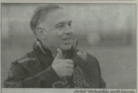
„რომას“ პრეზიდენტი ვეჯის პალოტა