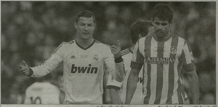
კრისტინო რონალდო და დიეგო კოტას შესანიშნავ ფორმაში არიან

ნუთი ადრე, მასპინძლებმა პენალტის დარტყმის უფლება მიიღეს, თუმცა ზენიტმა ყოველი უაღრესად კარგი გეიტინა და 11-მეტრიანი ვერ გამოიყენა.