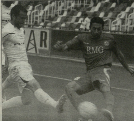
სიონს აღქმანდერ ცოტობერძემილის გამოცდილება არგია

ფეხბურთის დედნაციის სურვილია, რომ საქართველოს ასაკობრივი ნაკრებების სპორტიორების მატების უზრუნველყოფა და ფეხბურთ, ეს მისამართი გზარჩაბდა ფეხბურთის პოპულარიზაცია მსურველს ზღბს, ოლინპად, საკანონო ვერ იწინება სპორტიორებისთვის - ფული და მისი სწრაფი - ვერა თუ