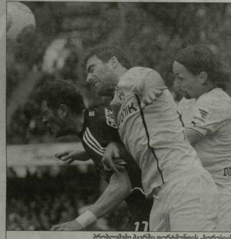
პრობლემები პარტიზო მუქნილის, პორცხუნის შეცვლები (სტრუტე) ხო სტრატისი და ნევე სუბოტიკი) ცხანსაკუთრებით სტანდარტების დროს უჭირთ

საერტის ფორმოდენ, რომ „ბაიერის“ ჩემპიონთა ლიგა ხელს შეუშლიდა, მაგრამ „ფრაიბურგის“ დიდ დატვირთვებს თავს ვერცხრობითი კარვად არიბმენენ, რაც სათადარიგო ფეხბურთელების დამსაბურთაა. „ლევიკოპუნე“ თავიკი საბი პიპია რეკონსტრუქციის თამაშად მიმართავს და შედეგიც აქვს - იმ მთავარეზის, რომცხად სასტარტი იმ მომენტებში, ყველაზე უკეთ რომი არსი გამოიყურება. შესაბამისად, დიდი მანსია, რომ ფინდება სეკვილიკაბეს მუნაგდებლობა „ჰამბურგის“ შედეგებში შეეცვალის. რაც მეტხედაც ახერგებენ: „პარცხუნე“ 6 ტურის შემდეგ 12 ქულით მოიხიბ ადგილზე, მაგრამ 12-ეუ ქულა საკუთარ მიუღებელ პეის მოპოვებით და მიროკ სლოკას შეეჭრდეს აგრუნდ სტურინად ცე სურთ ხერის ნახვა.