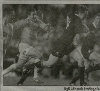
ბენ სტიონის მორიგი სალოლოვე გარდევვა