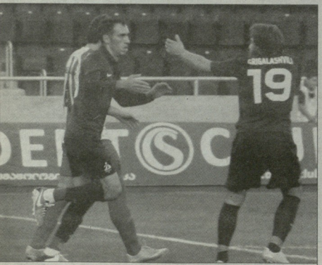
დღეით კორკველამ (მარცხნივ) მთავარსარეკორდო გუნდში დიდებულად გოლის ფოტო

მესამე ტურის გარდა, ყველა ტურში იყო თითო ისეთი შემთხვევა, რიცა შეცვლელზე შეშლონი ფეხბურთელს გოლი გაიტკრდა. აი, გენვლად ტურში, კი მარაბივეც საყურთელი რაოდენების ფაქტი დატკრდა და ვეცხეობი, მესამე შედეგი პირველი ტკბისი კი არა, საყურთელი ნინა სუპონისავე რომ გაიგებო. თავად ვასული: თომისხის შეცვლელბა ითავ გამოიჩინა შეცვლელზე შემოსულმა ფეხბურთელმა და მათგან ერთ-ერთის სულაც გამარჯვების მიზნითა გოლი გაიტკრდა სწორედ აქედან გვიღო დღეითაც: „მეტალურგის“ 26 წლის მვეცული გუბა ფიფია მოედანზე შეცვლებს შემდეგ გაიგებდა და თომისხის ავტორი თამაში ისტატურნი და რიცა მთავარი, 3 ქულის მიმტანი გოლი.