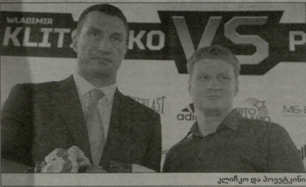
ვლადიმერ კლიჩკო და მიკალბრეტი