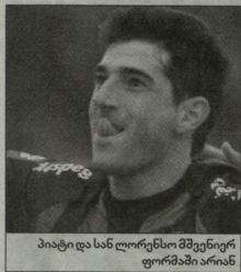
პიატი და სან ლორესიო მწვენიერ ფორმებში