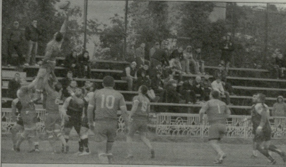
აია მორიკი დერფანი მოიგო

მე-5 ტურის ერთ-ერთი ცენტრალური დაპირისპირება ქუთათარ, აღნიშნული სტადიონზე გაიმართა. აიასა და არჩიას წველის მორის ვითარებას დასახელება ძალიან რთული იყო, ორივე გუნდმა ჩემპიონატი კარვად დაიწყო და სატურნირი ცხრალზე თამარბა ქუთათარის თამაშის გვერდ-დგვერდ მეორე-მესამე ადგილებზე იმყოფებოდნენ. კოდექსი ამის გათვალისწინებით მათ მორის უფავადი ბრუნა უნდა გამართოებოდა, მაგრამ მოლოდინ არ გასრულდა.