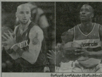
მარცხენა გორბატი (მარცხნივ)