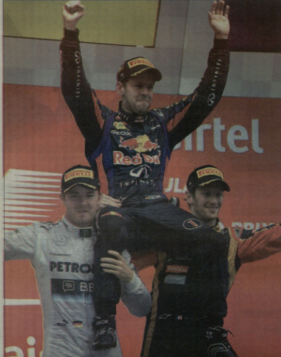
ფეტელი ტრულს ზეიმობს

ინფორმაციის გრანპრის მიგებით სებასტიან ფეტელმა იფიციალურად გაიფორმა მსოფლიოს ჩემპიონის შიოხზე ტიტულს, რედ ბულს კი კონსტრუქტორთა თასის მფლობელი გახდა.