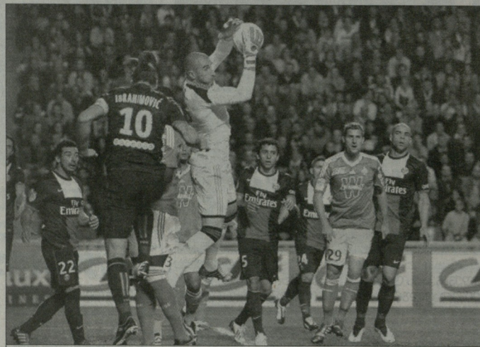
მე-20 ქულა ბოლო ნანტი გაეძაბრა