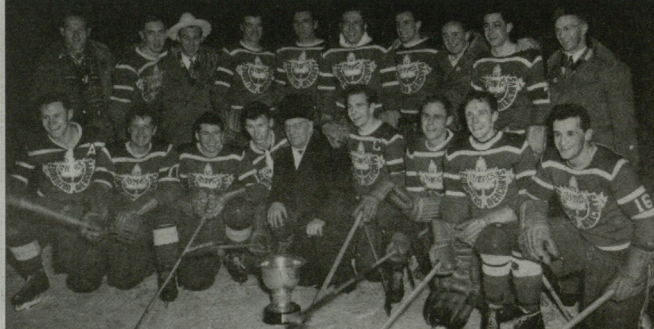
კანადის ნაკრები პოკეში

საბობაქროს მოკლების შემდეგ, პრეტენ-ულმა მამაქვი მოციურების კერებმა და მომუდლებდნენ მუციურსა მამაქვი ციურეზები ინტერესებში. მისი შვილი კრისტა და ერთ-ერთი - ქალიშვილი პრეტენის მსოფლიოს ჩემპიონი გახდა ქიორბოლები.