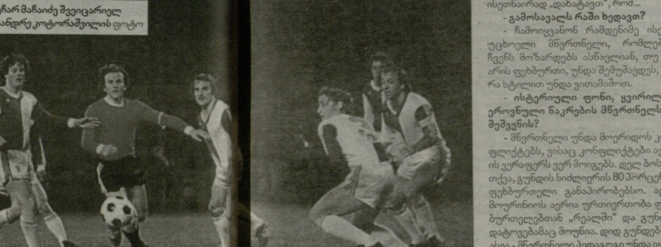
1977 წელს, დინამოს საბავშვო სკოლაში