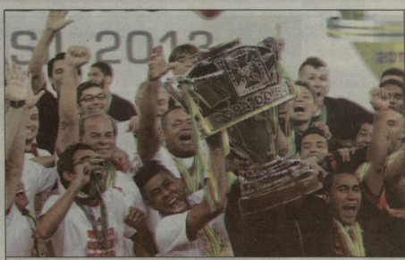
"ფლაშენგომ" ბრაზილიის თასი მოიგო