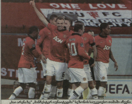
„ბარსელა“ „მანჩესტერი იუნაიტედი“ სეზონის საუკეთესო თამაში აჩვენა