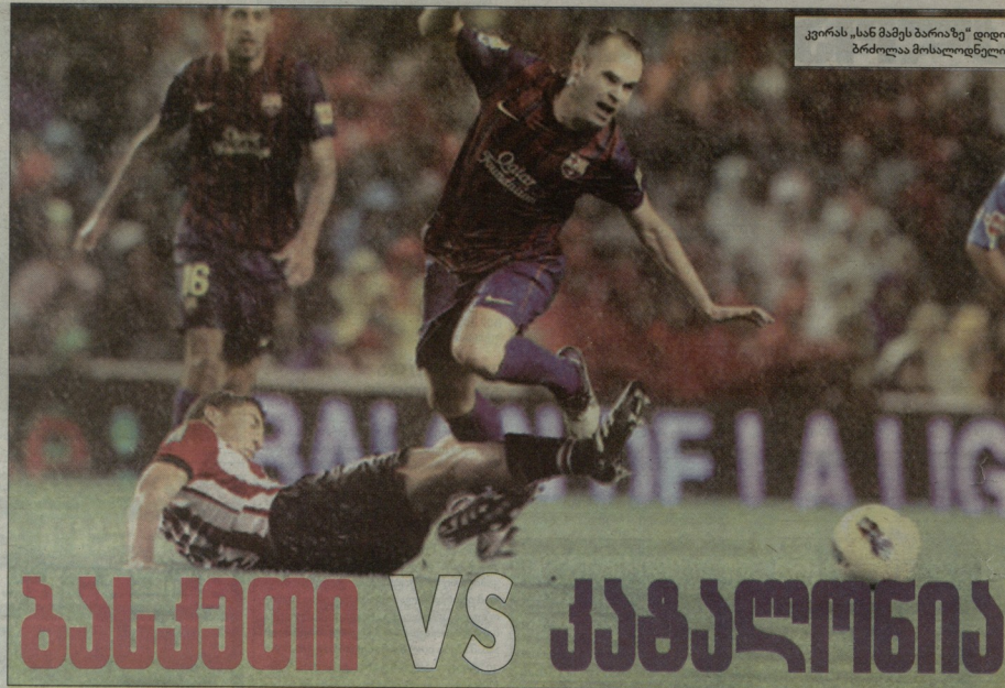
კვირას „სან მამეს ბარიაზე“ დიდი ბრძოლა მოსაძლევდელი