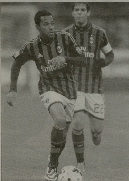
„მილანს“ რიზინიოც დააკლეს