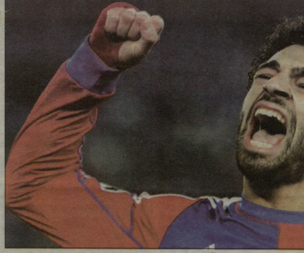
ეგვიტელი მოსამედ სალაჰი სრულიად შეცვლია გმირია

აღსანიშნავია, რომ მაღალი შეფასებები მიიღეს უეინ რუსონი (მანჩესტერ იუნაიტედი) და სამირ ნასრიმაც (მანჩესტერ სიტყი), მაგრამ ისინი სიმბოლოური ნაკრებში ვერ მოხვდნენ.