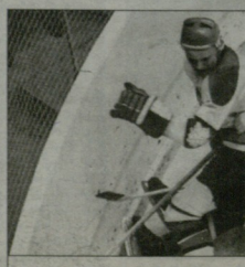
ოქტონი მატერი - სსრკ-კანადა

ტრანსის სიბრძნული გამო, ოლიმპიადი ტრანსილვანია დაწარულა და გარეგნის დროს დაიღობა ინფლუენცი კამპიტე სკი-15-ის კლავი ხშირი იყო ტრანსილვანიაში. ოლიმპიური სპორტის ამ სახეობაში პირველად გამოიყვანეს სასპოთა სპორტსმენები და სპორტული ნეკლოში გამარჯვება მოიპოვეს ლედილა ბელისოვიამ და ოლეგ პროტოპოპოვმა. ვერცხლის მედალი მოიპოვეს გერმანელმა - მარია კოლუმბა და პან-ლორენ ბაუშელებმა. ორი წლის მუშედეგ, მათი კვალი იყო ციგანის მიშედეგ, და მთილეს მანტეგორნატი რითაც გარეკი, რომ ოლიმპიადის დენგბაზე სპორტსმენებმა პირველი კორპორტული გაიყვანეს და ამით დაწარულეს მოცურებელი სპორტსმენის კოდეტი. 21 წლის მუშედეგ, გერმანელი ოლიმპიადებელი იმინ არ გამოიღდენ პირველი სპორტსმენი, 1987 წლის დეკემბერში, საერთაშორისო ოლიმპიური სპორტსმენი მათ დაბრუნდა მედალი.