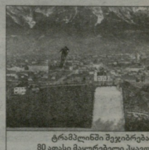
ტრამპლინი მუშედეგების 80 ათასი მავრეწველი მუშედეგად

დენგბეტი აღმოჩნდა მუშედეგად კანადისა და სსრკ-ს შორის, რომელიც საციფლი-მათების რედალი მინდარეობდა. მისი მუშედეგები 0-1-ს, 12-ს და მოხლოდ 39-ე ნეკლო ვიარჩეს სტანტინოვმა გათამაზა ანგარის, მესამე პროტოგის დასაწყისში კი ვენიამო აღლასანდროვმა გამარჯვების გული გაიხსნა - 32 და სსრკი შერბულა კანადის ოლიმპიური ჩემპიონი გახდა და ოლიმპიური ჩემპიონი გახდა.