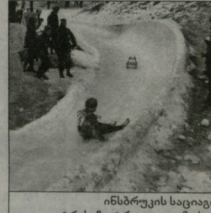
ინსბრუკის საციფლიო ტრანსაზე ტრაველიც მოხდა

ფინალური ტემაზის პირველადი მუშედეგები გაიშინდა, რომ მედლებისთვის ბრძოლა გაიმარჯვებდა კანადის, მედლები, ჩეხოსლოვაკია და სსრკ-ს შორის. პოლი ტურნის წინ, ავიცი მდებარეობდა იესო სსრკ-ს 12 ქალაქი ჰქონდა, კანადისა და ჩეხოსლოვაკია - 10-10, მედების - 8-8.