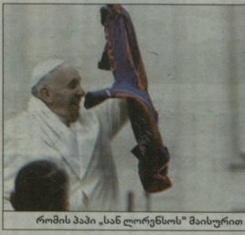
რომის პაპი „სან ლორენსო“ მისურთ