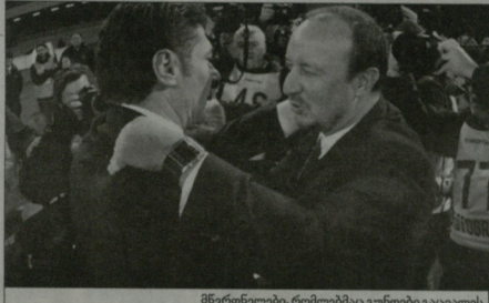
მწვინტლები, რომლებმაც გუნდები გატყველეს

რაფელ ბენიტესი (ნაპოლი): „კარგ თამაშს ველოდებოდი და ჩემი მოლოდინი სრულად გამართლდა. ინტერი“ შესანიშნავი გუნდია, რაც კიდევ ერთხელ დადასტურდა, ჩვენი გამარჯვება კი მით უფრო დადასტურებულა. თუმცა, თქმა არ სჭირდება, რომ კიდევ ბევრ კომპონენტში გვაქვს მოსამტეველი - ბურთის უკეთი კონტროლია საჭირო, რადგან ვერცერთიბი, კონტრეტტევაზე თამაში უფრო ვგიადასტურება. რა თქმა უნდა, ეს არაა „ნაპოლის“ მატსმუბი, ჩვენ ვაცილებით უკეთ მეტყვილიბა თამაში“.