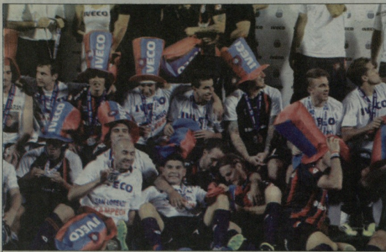
„სან ლორენსო“ ზვიგობს