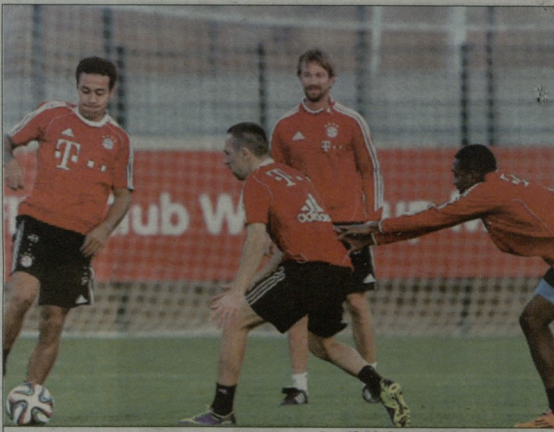
„მაგრი“ მუნდილის მოსახვედრა ეტაბზე

სამოწავარი საკლუბო ჩემპიონატის პირველ ნახევარში ლინი და გვარდიოლა ერთმანეთს ახიხი და ვერობის ჩემპიონის ლიგის გამარჯვებულები და-სან ლორენსო ლიგის „გუანდო“ ვეგერანდი, ხოსე გვარდიოლა „სან ლორენსო“ ნი-ნახამდე, ორივე გუნდი საკლუბო მონდილივი პირველად მონდილივი და თ „სან ლორენსოს“ საკლუბო მატჩი იტება, ჩინელსა პირველი შეხვედრა უკვე გამართოს და შესაძლებელია ეტაბზე ეკვიტრ „ალ პლანს“ (სერვის ჩემპიონის ლიგის გამარჯვებული) 2:0 სილეს. ახლები მზრდად გუნ-ღებულები ლიგურება, ბრახილიება ეტაბ-