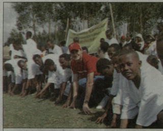
ფედერერი აფრიკელ ბავშვებში

ძალაუნებელი ამერიკელი ფრამმა, რომელიც ცვალებების მომენტებზე სპეციალიზებად, ვარლების ახალი ვარიანტების შექმნისთვის, ბელარუსის ვიდეორეჟის ახარენკას საბატონებზე დაინიჭა. „სალაი, ვიკა, მე ვებრუნებ ცვლებების მომენტებს კომპანიაში. ჩვენ ვარების ერთი ვარიანტი უკვე საბატონებზე დაივარა: VA-VIA VICTORIA“, - დანერ თვის „ბიზნეს-რევიუ“ უნებ პეილ პანტონმა. „ბიზნეს-რევიუ“ - მშობნი გამოცემურა ამ ამბავს ახარენკას.