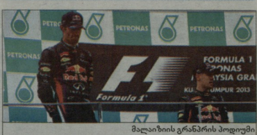
მალიაჩის გრანპრის პოდიუმი