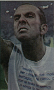
პაოლი და კანიოს კლავიო ლიტატოსთან მუშაობა არ უნდა

ლაპირი ლამა კონისიბია, კლუბის მსვლელები კი გამოსავლეს მიტენ. პრესასთან კონტრატი პრეტენდებმა, კლავიო ლიტატომ გააკეთა და უპრეტობია, ვერ მას დავდეკეთ სიტყვა: ასე ვავრეტლება ლარ მუშოლება - ფაქტია, რომ სერია B-ში ცვლილებები გვჩვენდება. თუცა, არ მსურს ცვლილებების გაკეთება ცვლილებებისთვის; მთავარია, ნებისმიერ გადაწყვეტილების სერიოზული საფუძველი ქონდეს. ეს საბურთე ვლავიანი პეტკოჩის და სმარიალე გიბინარაი, ბოლომდე თავდაფრებული არ მომეცენა. რამდენიმე საკუთალისტზე ვფიქრობ, მაგრამ ეს იმსა არ ნიშნებს, რომ მწირბრელი აუცილებლად შეიკლება. ფაქტია, რომ მსვლელები თავიდან უნდა დაკვიროს. კლავიო ლიტატოს კონტრატი ისეთივე არეულია, როგორც ლაციოს თამაში მიმდინარე სეზონში, მაგრამ ერთი ცხელია - პრეტენდენტი ცვლილებებს გვამა. უკვე ვადაწყვეტილია, რომ 2014 წლის მუნდიალის შემდეგ, ვლავიანი პეტკოჩივი შევი-