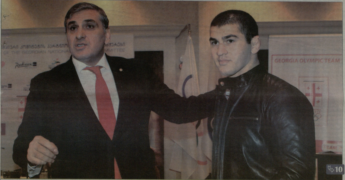
სეოკის პრეზიდენტი ლერი ხაბელოვი და საქართველოს საუკეთესო სპორტსმენი ავთანდილ ჭრიკიშვილი

ვინ არის პირველი ქართველი ოლიმპიური ჩემპიონი?