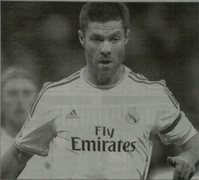
რას ვადაწვევებს ჩაბი ალონსო? დარჩება „რეალში“ თუ ინგლისში დაბრუნდება?

„ბარსელონას“ შიდა მწრთობელ ხერარდო მარტინოს ფორვარდის შექმნაც სურს. პრესის ათრითილე გაიფიქრა რობერტ ლეგაშისკისა და სერხიო აგუეროს გარეშად, მაგრამ ეს ფორვარდები სათადარიგო თავდასხმების როლზე ნამდვილად არ დათანხმდებიან. კატალიზლებს კი ისეთი ფორვარდი სურთ, რომელიც კლუბს ისევე დაეხმარება, როგორც პანკრეო ლარსონმა გააკეთა ფრანც რაიკარდის ეპოქაში. გასაფილანსინებელი ისიც, რომ მუდგონ, სესკ ფანჯრის და ალექსის სანჩესის ძალიან კარგ ფორმებში არიან. დუმატეტი ამას ნეიშარი, გამოვანძომილებული მესსი და თამაშად შეუძლებელი ფორვარდი, რომ ფორვარდის შესაძენად „ბარსას“ ხელშეწყობები დაიდა და იტყვიან. სამაგვირედ, სპინრობელ დორეკტორ ანდონი სუბსარტეხს მუკარის საკოინტო მოწოდეს მუშაობა. ვიქტორ ვალდის კონტრაქტი იწყდება და მას შემცველად სურვლება. მარცხ-ანდრეს ბურ შტევენი და პეპე რინა უკვე დღი