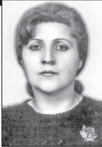
დღეს მისი გარდაცვალებიდან წელიწადი სრულდება. ნათელი და სანთელი, პატივი და არდავიწყება, ჩვენო ბელა!